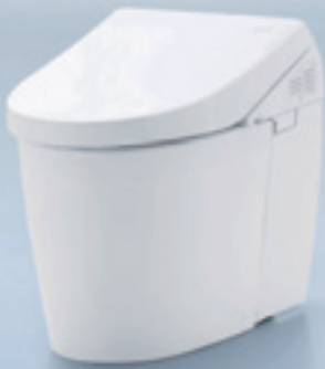
直線基調で空間と調和する AH

TOTO最高級便器、ネオレストシリーズがデザインを一新。 「機能」「デザイン」で“きれい”にこだわりました。