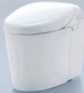
曲線基調で空間アクセントとなる RH