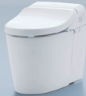
ベーシックな形状で空間を選ばない DH