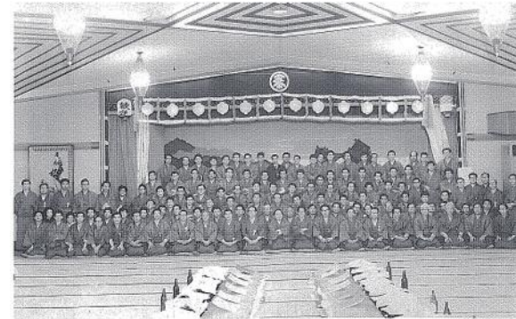
JCD日本店舗設計家協会 社団法人創立総会 於：古賀の井 S38.1.20