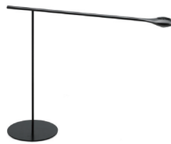
| FLOOR/DESK STAND