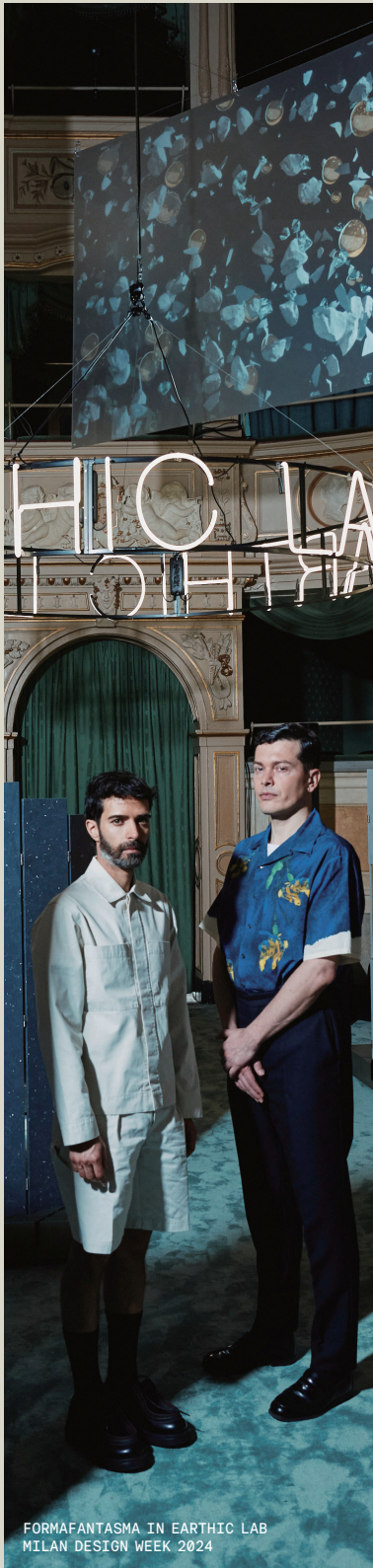
FORMAFANTASMA IN EARTHIC LAB MILAN DESIGN WEEK 2024