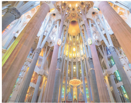
神秘の森とも呼ばれる、サグラダ・ファミリア聖堂の内部中央