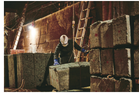
1 栃木県で採掘される大谷石。