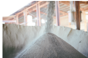
3 その廃材を粉碎・粒子化し、リライトの原料として再利用。