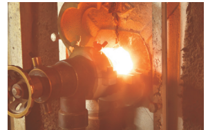
4 成形した土をトンネル窯で焼き締めることで、固く焼きしまったタイルになります。

原料に大谷石の廃材を20%ブレンドしたリサイクルタイル。表面にも大谷石の粉碎粒を振りかけて、一枚として同じものない独特な風合いに仕上げました。その豊かな表現力により、和から洋まで、インテリアの可能性がますます広がります。