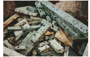
2 採掘場で様々な形状に加工された結果、大量の廃材が生じる。