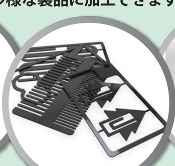
雑貨や商品パーツ