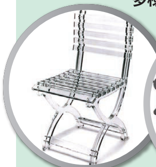
イスやテーブル パーティーション